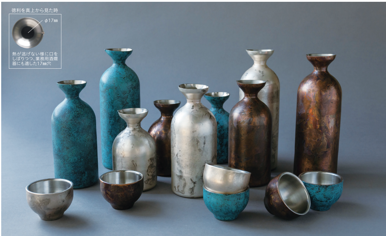
徳利を真上から見た時