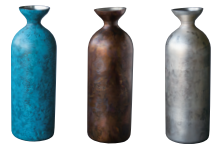
ブルー カッパー レッド アンティーク シルバー

和の伝統を感じさせる、洗みのある鮮やかな色合いと、一つ一つ異なる模様で高級感のある仕上がり。和モダンなフォルムはどんな場面も上質に演出します。保温性・保冷性に優れ、割れる心配のないオールステンレス製でお手入れも簡単。